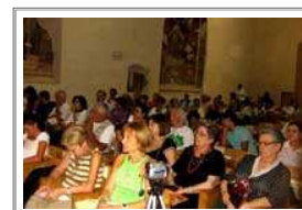
Pubblico ai concerti

www.umbriaclassica.com fernandomartinelli@libero.it Tel. 348.0527841 - Tel. 340.7896840