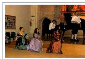
Concerto allievi corso di canto