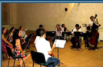
lezione di musica da amera