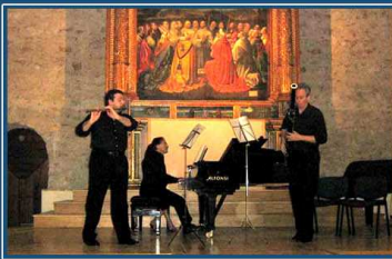
concerto dei solisti della Scala