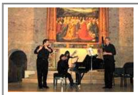
Concerto Zoni-Screpis-Di Cesare

Docente di Composizione Conservatorio "Licinio Refice" di Frosinone